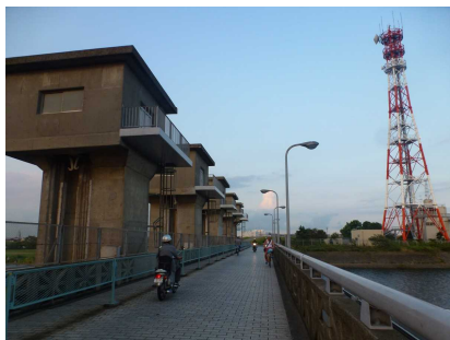
東京と千葉を結ぶ江戸川水門。都県の間で5年前33円の最賃格差は94円まで広がった。

東京 13円引上げ850円 神奈川 13円引上げ849円 埼玉 12円引上げ771円 千葉 8円引上げ756円